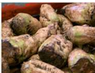
STIMA TARA A VISTA