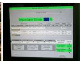
PROGRAMMA GESTIONE DATI