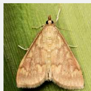
adulto di piralide