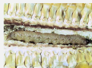
Larva di piralide