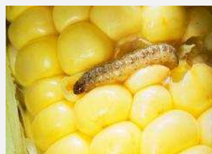
Danno da piralide sulla spiga

I rilievi riguardano, principalmente, le dinamiche dei voli del lepidottero, al fine di individuare correttamente l'inizio dei medesimi e il picco massimo di catture nei singoli ambiti colturali. Questi rilievi, effettuati con ausilio di trappole a feromoni e luminose, sono completati dall'osservazione diretta delle ovature sulle foglie. Tali informazioni consentono di individuare il momento idoneo per eseguire l'intervento. A tale riguardo, sono disponibili servizi agronomici che elaborano bollettini di allerta indicanti, per ogni specifica area di coltivazione, tutte le informazioni finalizzate a programmare, con tempestività, un trattamento efficace.