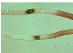
danno indotto da atomaria