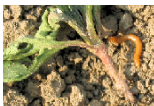
danno indotto da elateride

Nelle prime fasi colturali alcuni fitofagi possono danneggiare le plantule in emergenza e gli stadi immediatamente successivi. Una presenza significativa di questi parassiti può indurre rallentamenti dello sviluppo colturale e investimenti irregolari. Per quanto concerne i danni a livello radicale e del colletto, i parassiti più temibili sono: elateride, atomaria e nottue terricole. L'altica è, invece, un coleottero che provoca piccole e numerose rosure a livello fogliare.