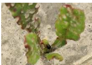
danno indotto da altica

Occasionalmente si possono, inoltre, riscontrare danni ascrivibili a pentodon punctatus , scutigera , collemboli , blaniulidi , grillotalpa .