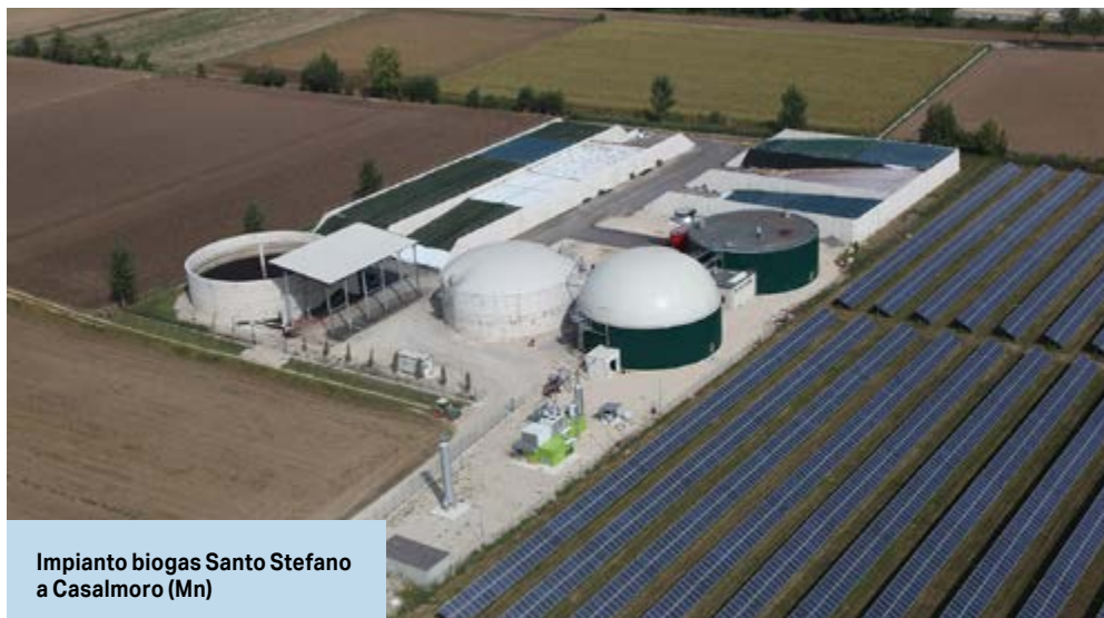
Impianto biogas Santo Stefano a Casalmoro (Mn)

A dimostrazione dell'impegno concreto che Bnl ha assunto, ormai da qualche anno è attiva, a livello di Direzione Centrale, la struttura del Green Desk. Competenze specifiche nel settore agrario e delle energie rinnovabili ed una filiera dedicata su tutto il territorio nazionale hanno contribuito a rendere la Banca un partner di riferimento per tutte quelle controparti imprenditoriali che direttamente o indirettamente desiderano cogliere le interessanti opportunità nel settore delle agroenergie e, in particolare, nel biogas-biometano. Infatti la struttura dedicata del Desk fornisce all'azienda agraria il supporto necessario per approc-